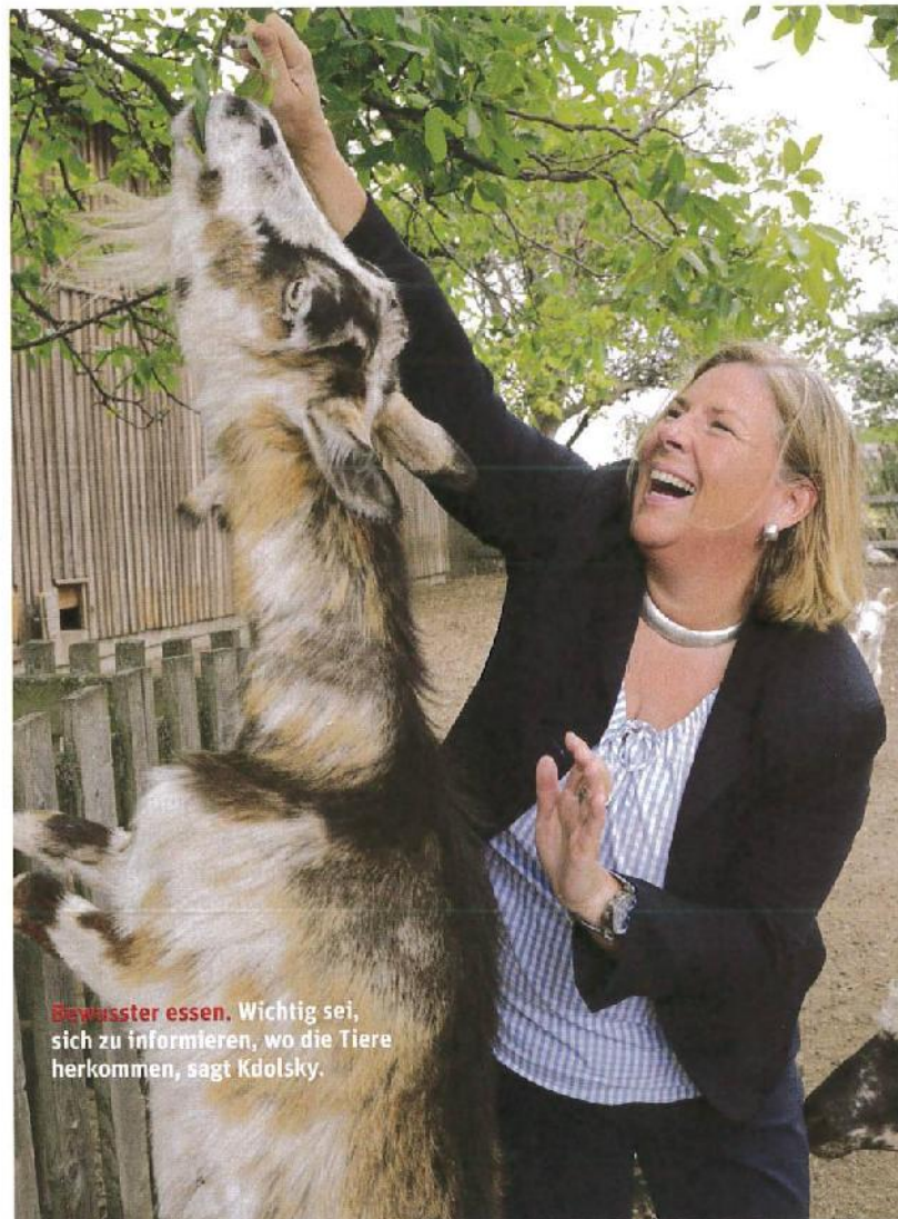
Bewusster essen. Wichtig sei, sich zu informieren, wo die Tiere herkommen, sagt Kdolsky.

rungsmitteln. Man isst es dann halt nicht mehr fünfmal pro Woche, sondern gönnt sich ein- oder zweimal in der Woche ein qualitativ hochwertiges Stück Fleisch. In Österreich werden 2014 nur mehr 12,6 Prozent des Einkommens für Lebensmittel verwendet. Das ist ein Tiefstwert. Doch wenn man so billig anbieten muss, besteht klarerweise der Zwang, Masse zu produzieren. Und Massenproduktion endet in zentralen Schlachthöfen. Solange es noch Hofschlachtungen gegeben hat, wurden die Tiere viel besser behandelt: Sie hatten zum Teil Namen, und die Kinder waren einen Nachmittag lang traurig, wenn „ihr“ Schwein geschlachtet wurde. ▶